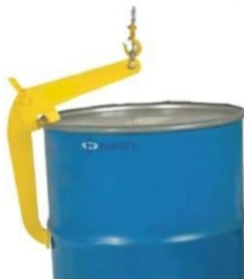
Рисунок 2. Работа захвата